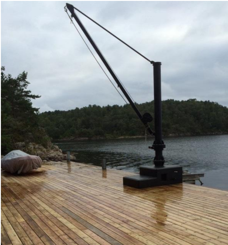
Vedlegg 2: Skisse av prosjektert kran