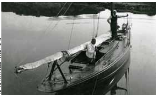
75 KVM: En 75 kvm i Bergen, sannsynligvis «Pus». Merk den lange storseilsbommen i det opprinnelige designet.