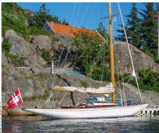
«PUS»: Fortøyd ved ved familien Øslebyes sommersted i Ny Hellesund.

NYTT FRA VÅGSBYGD SEILFORENING • vagsbygdseilforening.no